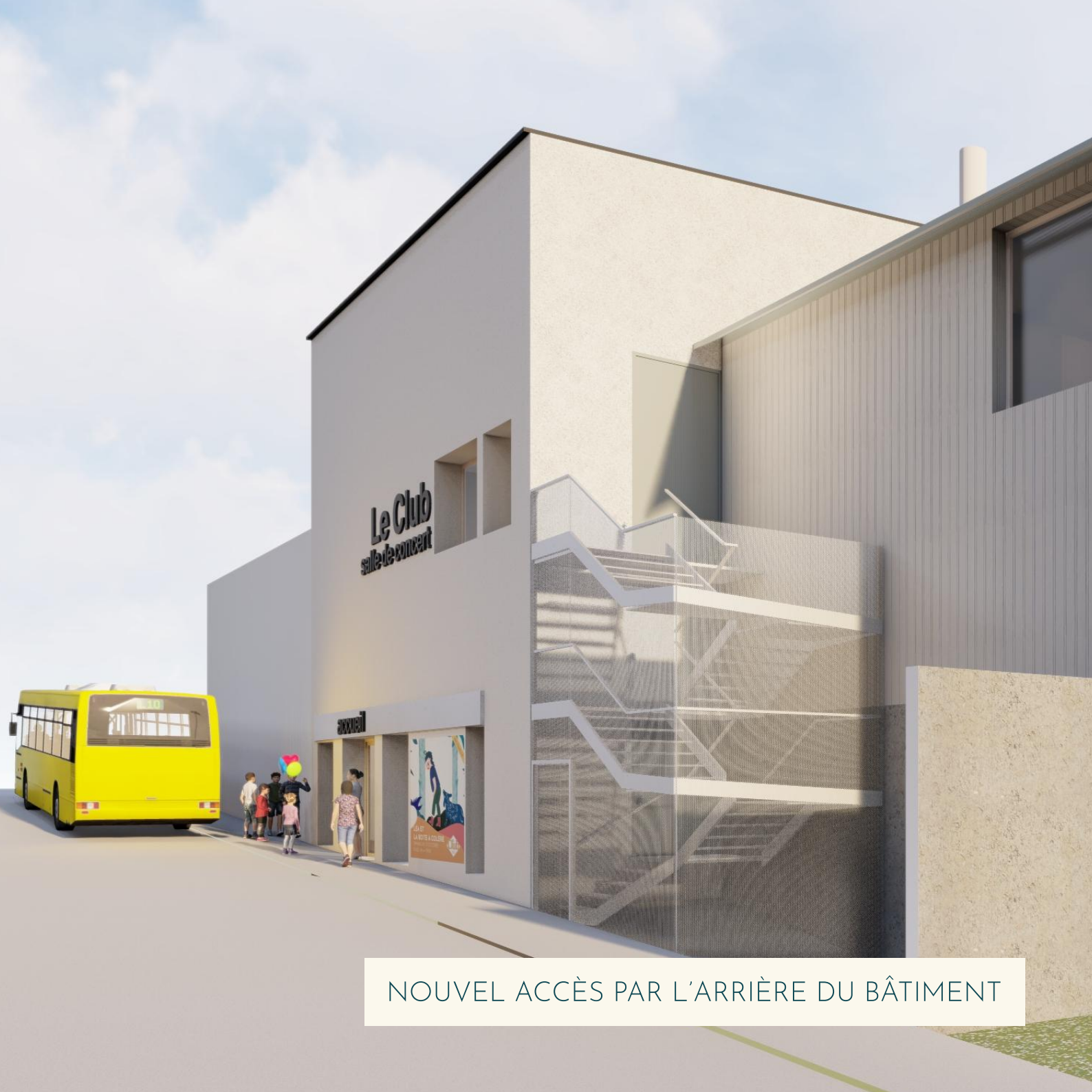
NOUVEL ACCÈS PAR L'ARRIÈRE DU BÂTIMENT